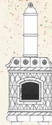
PIEC GRAND VICTORIA

Waga 300 kg Wysokość 126 cm Szerokość 68 cm, Głębokość 68 cm Załadunek drewnem 3,5-6 kg Ciepło zakumulowane do 23 kWh Moc grzewcza na 12 godzin = 2 kW Optymalna wydajność dla powierzchni 45-50 m kw.