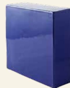
KAFEL PÓŁKOWY NAROŻNY W KOLORZE KOBALT