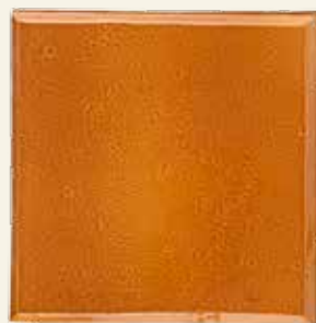
KAFEL PODSTAWOWY W KOLORZE MIODOWYM