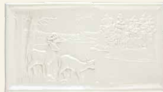
PŁASKORZEŻBA W KOLORZE ÉCRU