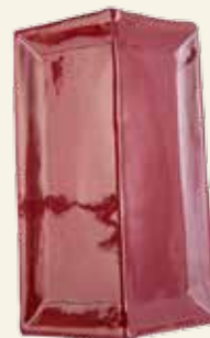
KAFEL NAROŻNY W KOLORZE BURGUND