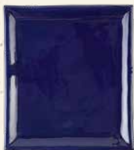
KAFEL PODSTAWOWY W KOLORZE KOBALT

Możesz wybierać spośród gotowych projektów lub przekazać nam wytyczne do zaprojektowania go dla siebie.