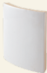
KAFEL PODSTAWOWY ŁUKOWY W KOLORZE BIAŁYM